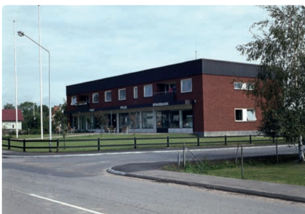
Östra Husby post- och bankhus på 1970-talet.