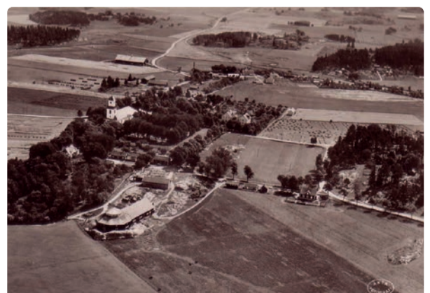
Östra Husby år 1947.