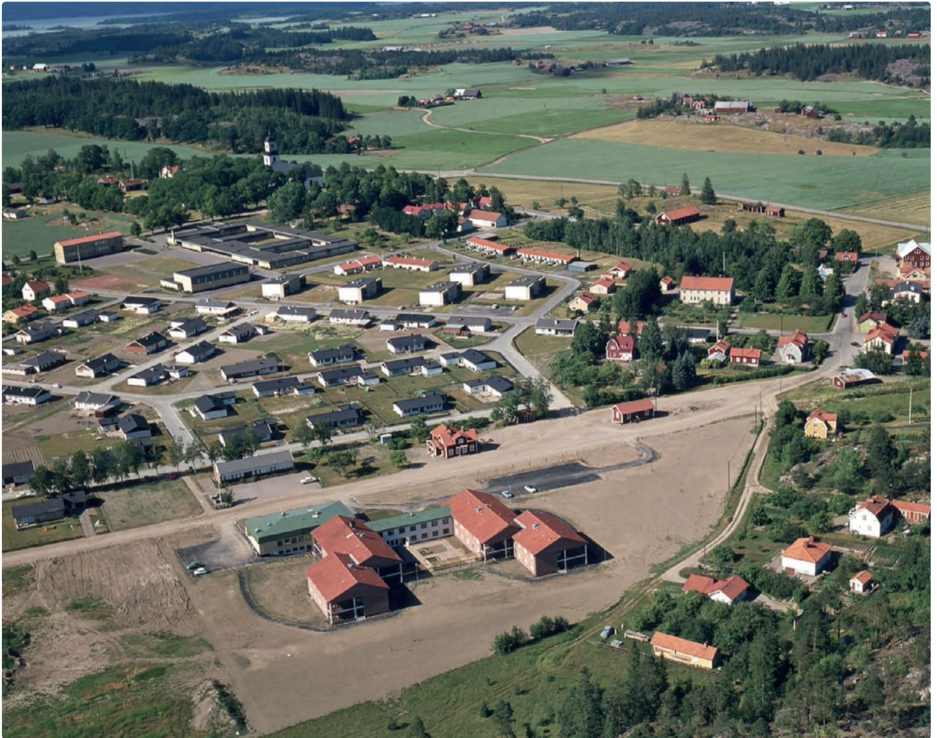
Bygdevägen 15, Östra Husby år 1971.