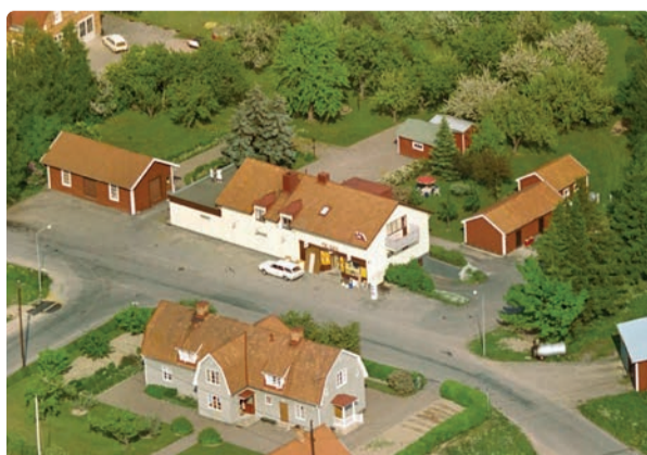
ICA-butiken år 1974.