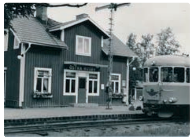
Järnvägsstationen på 1950-talet.