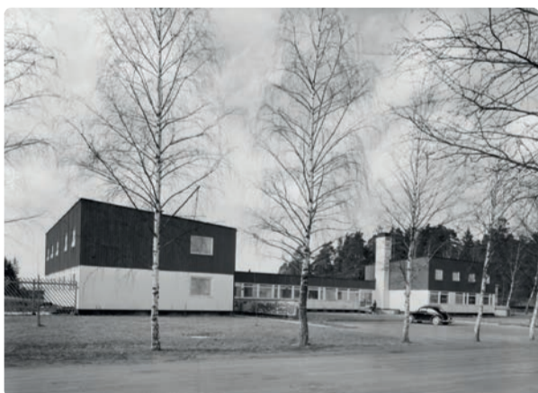
Gamla vårdcentralen år 1961.