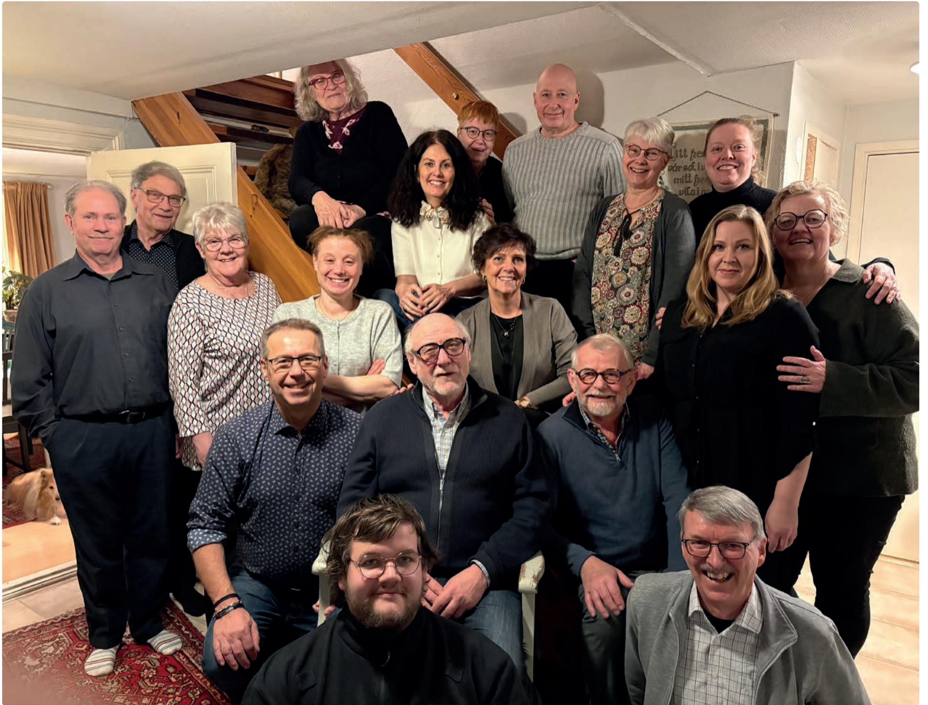
Föreningen Vikbolandsspelet har skapat lokal kultur sedan 1983.

Vikbolandsspelet: "Vi är tacksamma för att vår publik är oss trogna och återkommer år efter år, och föreningens rötter och engagemang i lokalsamhället bidrar till att kulturen hålls levande bland annat vid våra återkommande allsångstillfällen på äldreboendet i Östra Husby."