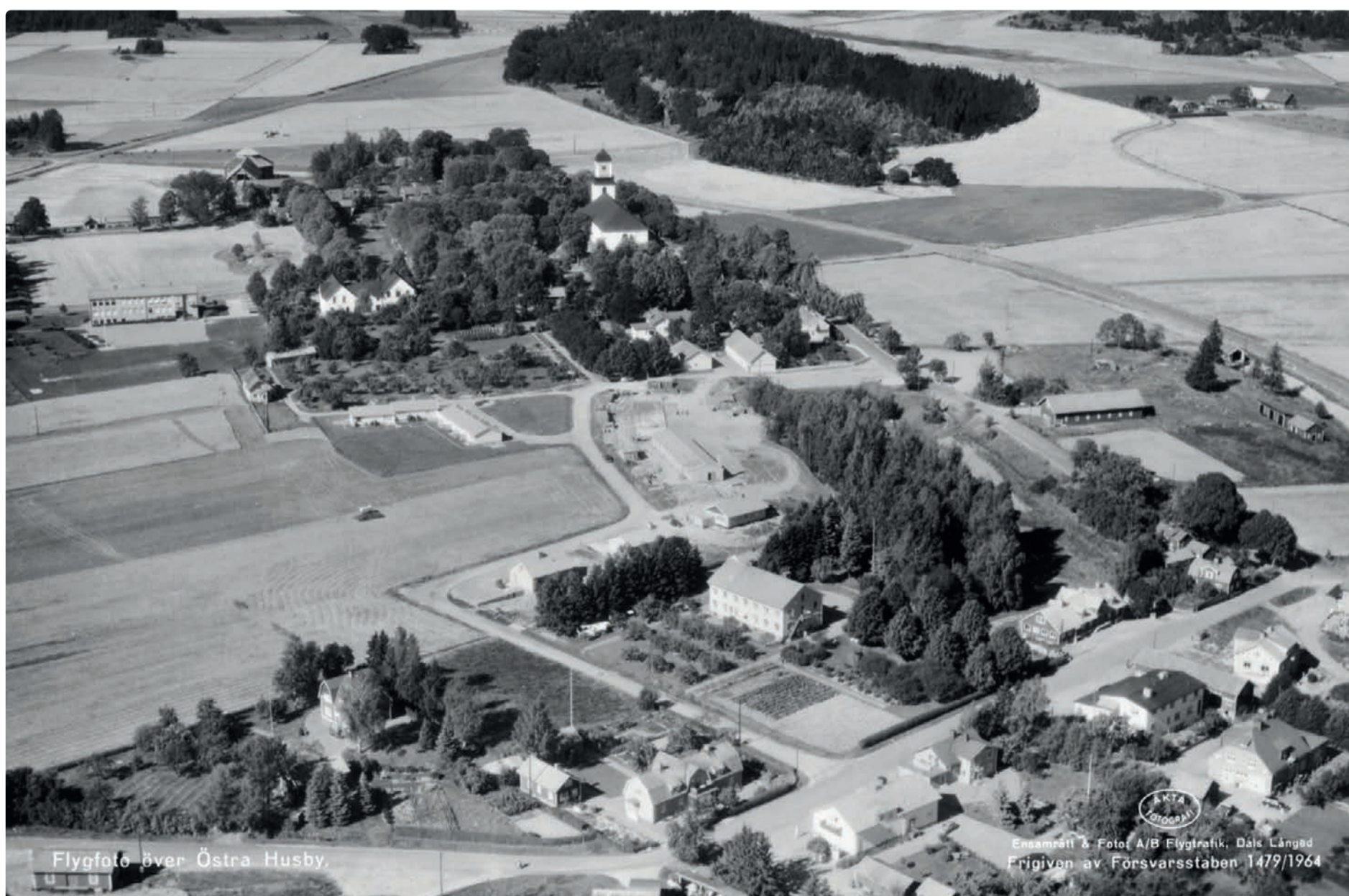
Flygfoto över Östra Husby.

AKTA FOTOGRAF Ett samrätt & Foto A/B Flygtrafik, Dals Långed Frigiven av Försvarsstab 1479/1964