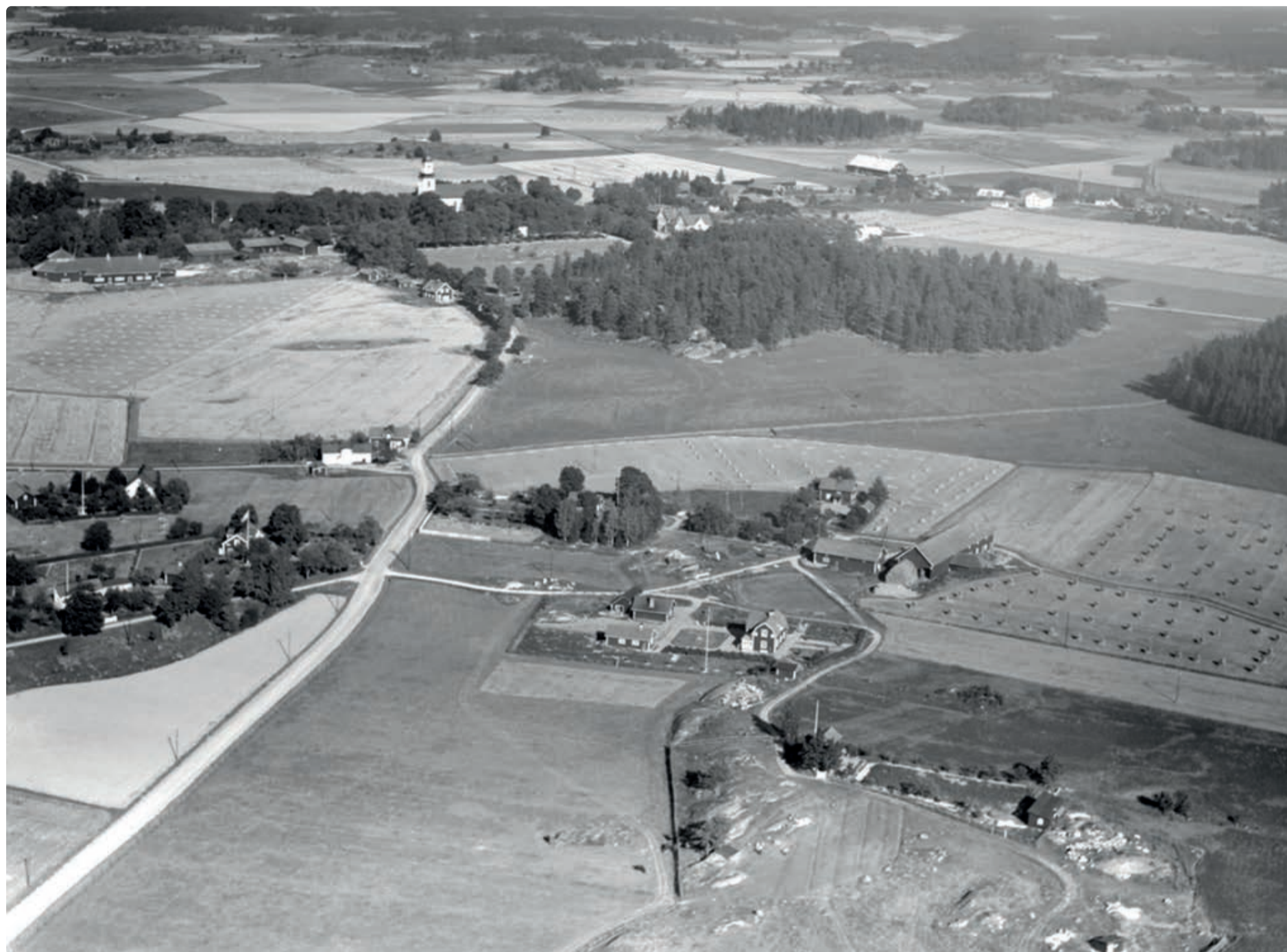
Östra Husby på 1930-talet.