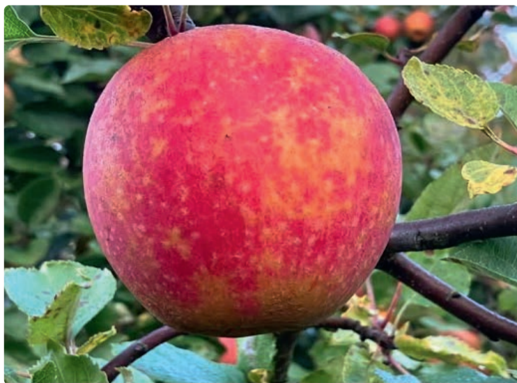
Ett av de uppskattade äpplena från Valtersen Mellangård.