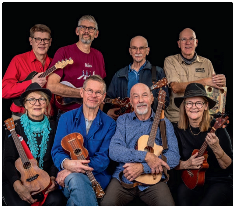
Originaluppsättningen av Ukebox.