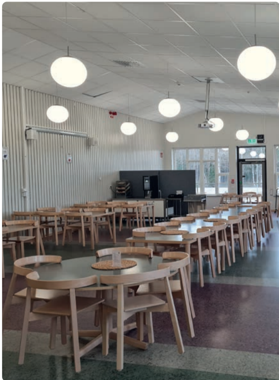
Den fräscha matsalen.