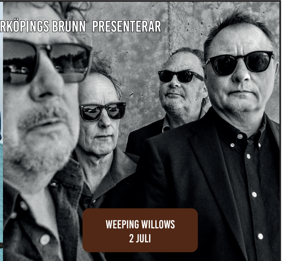
WEeping WILLOWS 2 JULI