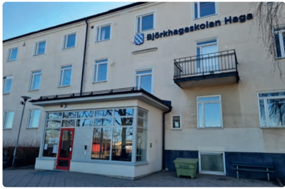
Björkhagaskolan i Söderköping.