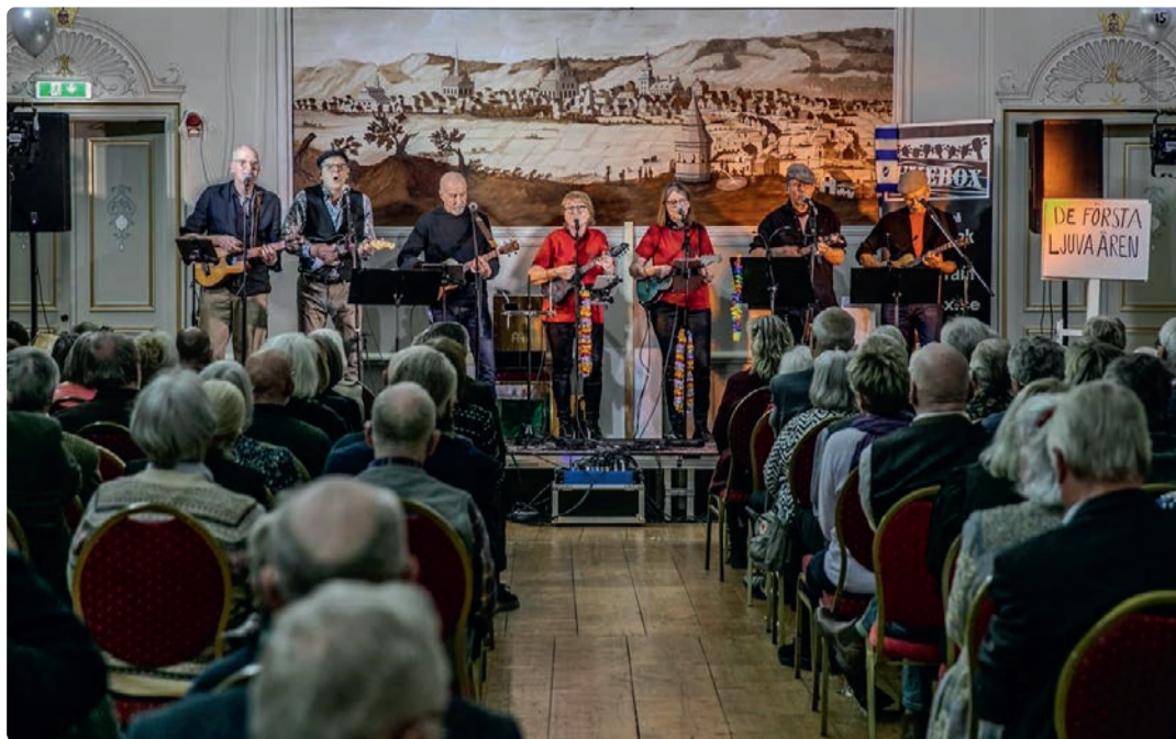
Jubileumsspelningen på Brunnsalongen som var så gott som utsåld.