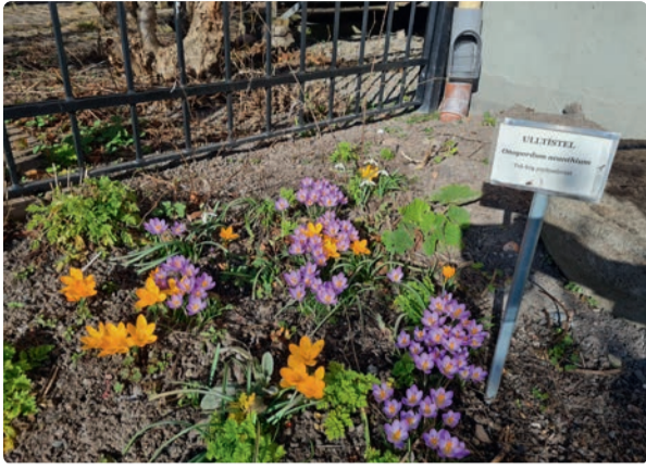
Det blommar i rabatten.