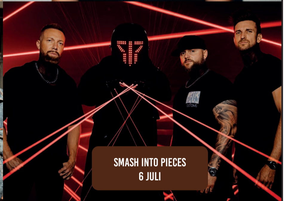
SMASH INTO PIECES 6 JULI