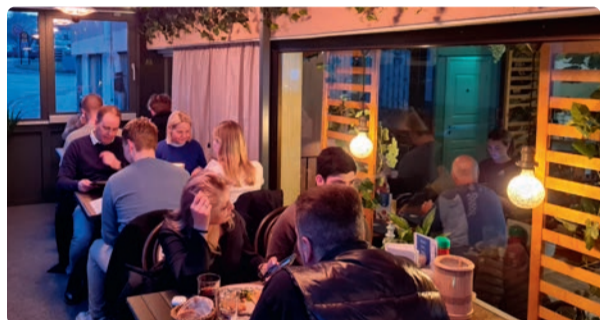
Fullsatt i det inglasade uterummet.

Som en del av en franchisekedja får vi bra avtal med leverantörer och hjälp med marknadsföringen. Konceptet och menyn utvecklas hela tiden.