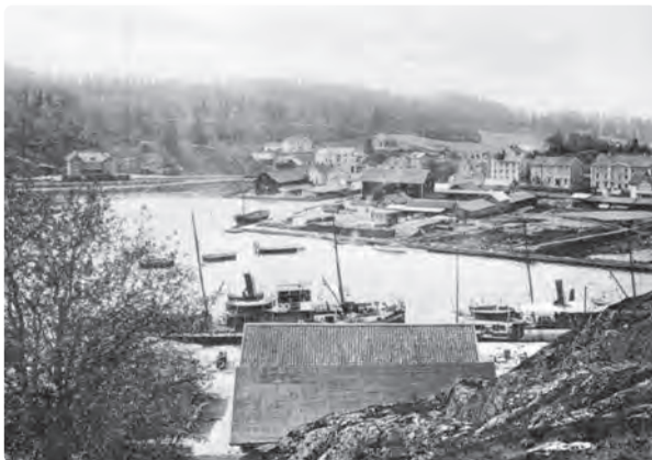
Längst bort i bild syns Storgatan. Bilden är från 1905.