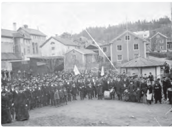
Demonstration för allmän rösträtt på Storgatan och Norrgatan cirka 1921.