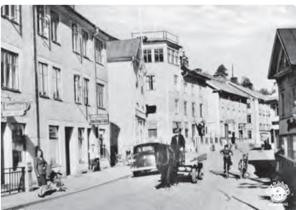
Nere till höger ligger Albatross Marine Chartering, Vångströms Golv och färg med flera. Norrköpingsfotografen Larsson står bakom vykortsmotivet taget omkring 1960.