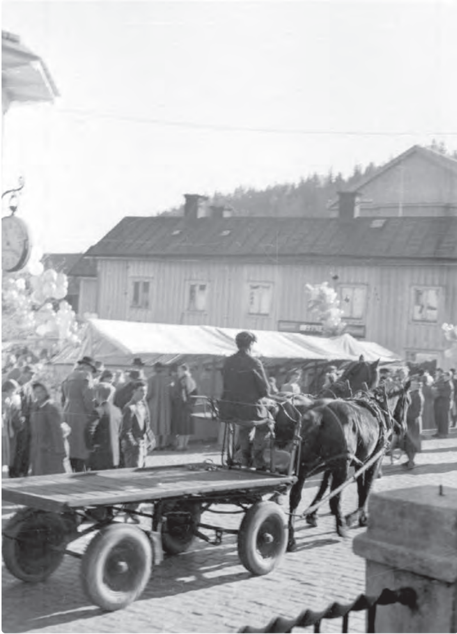
Oktobermarknad på Storgatan från mitten av 60-talet.