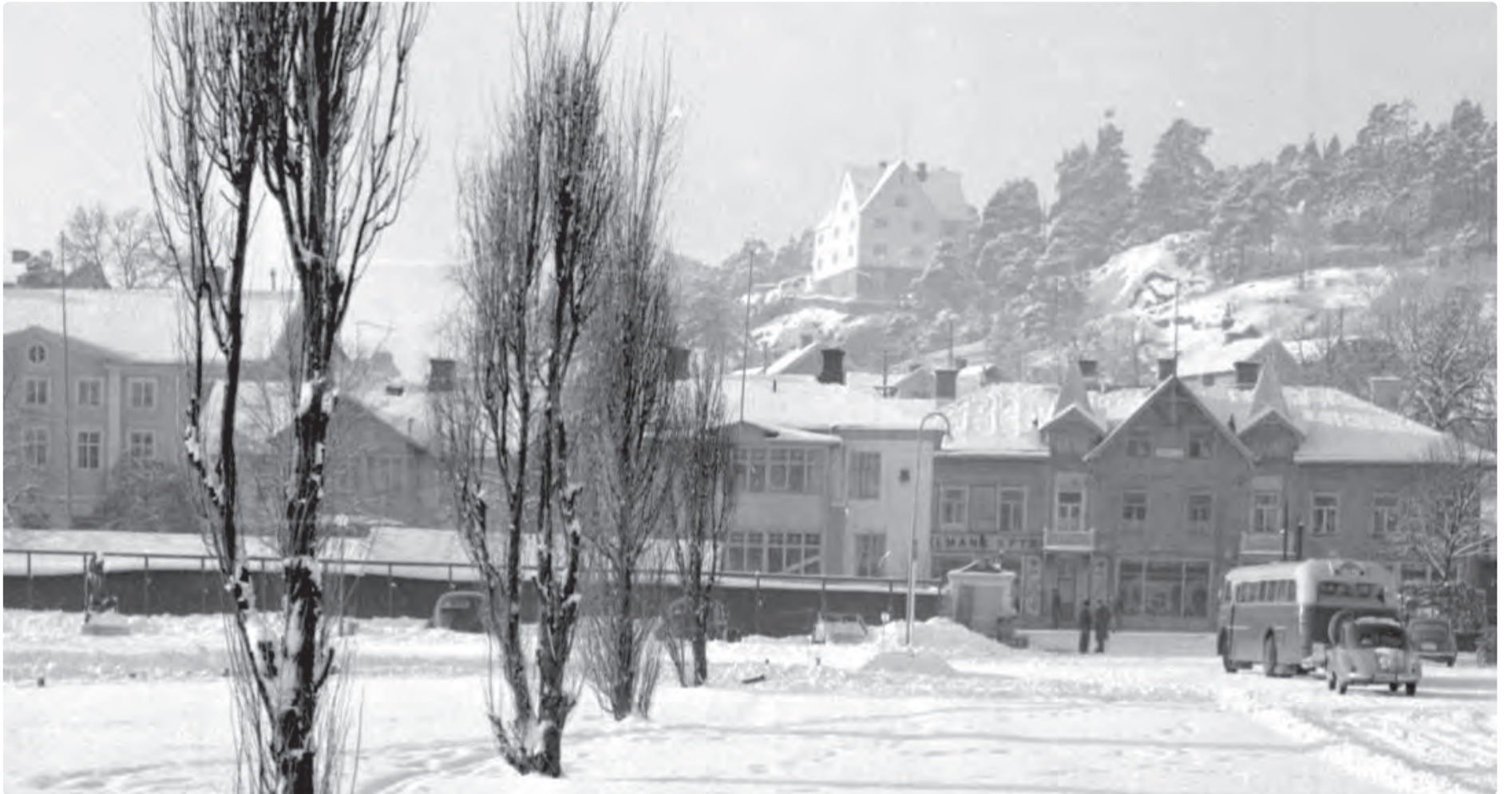
Vy mot Storgatan med Ählmanshuset i bakgrunden omkring 1957. Vet någon varför allén planterades ner mot hamnen? Mejla Söderköpings-Posten på: info@soderkopingsposten.se