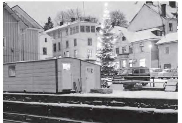
I huset bakom granen ligger idag Samelius Ur och Guld samt Farmors hus. Bilden är från 1963.