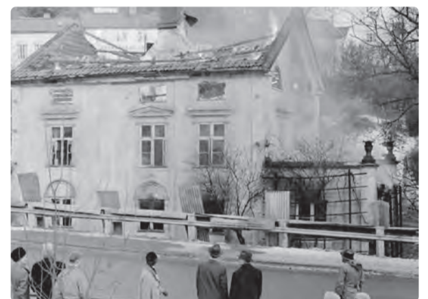
Strömsvik som brändes ner för att ge plats för nuvarande kommunhus från slutet av 60-talet.