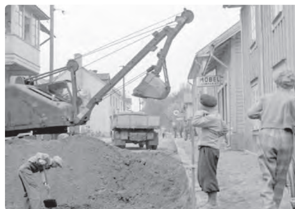
Dåvarande Storgatan numera Garvaregatan. Bilden är från omkring 1950.