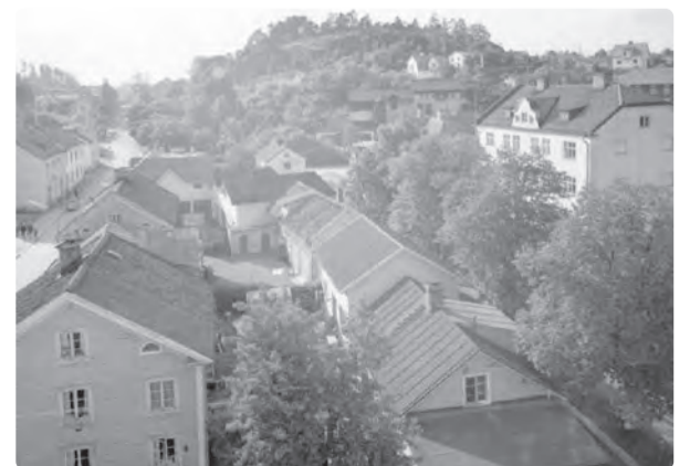
Dåvarande Storgatan längst bort till höger syns Konsum och Gusums mejeri. Bilden är tagen cirka 1950.