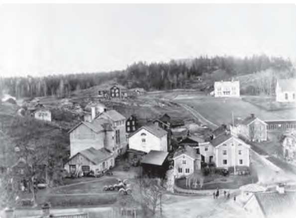
Bryggeriet, Storgatan i förgrunden från tidigt sekelskifte omkring 1907.