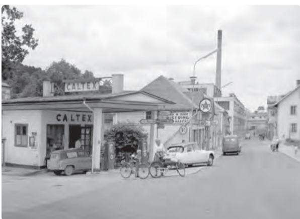
Korsningen dåvarande Storgatan numera Garvaregatan och Hamngatan från 1959.