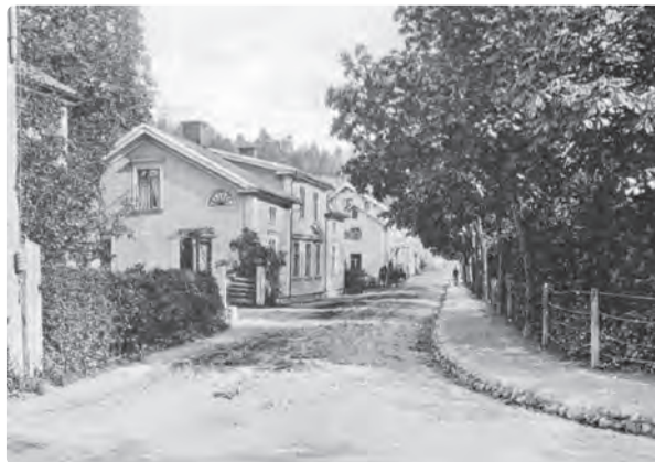
Nuvarande Storgatan tidigare Lillgatan, från cirka 1912.